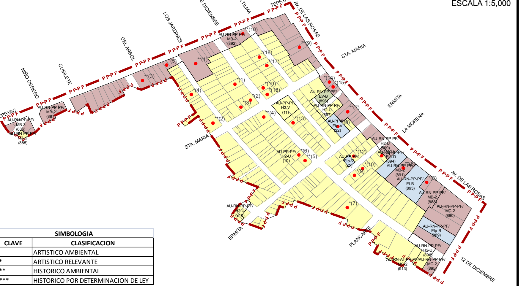
UBICACION DE PREDIOS CON VALOR PATRIMONIAL, CHAPALITA ESCALA 1:5,000