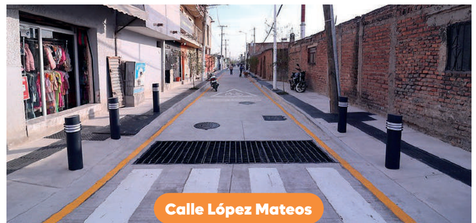
Calle López Mateos