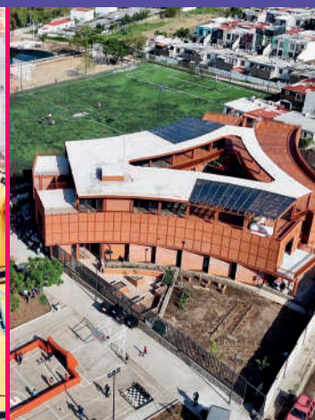
Valle de los Molinos ¡La más nueva!

Checa las actividades en nuestras páginas de Facebook: @Micolmenamiramar @Micolmenasanjuandeocotan @Micolmenavilladeguadalupe