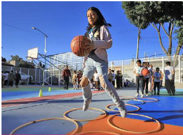
Unidad Arenales Tapatíos