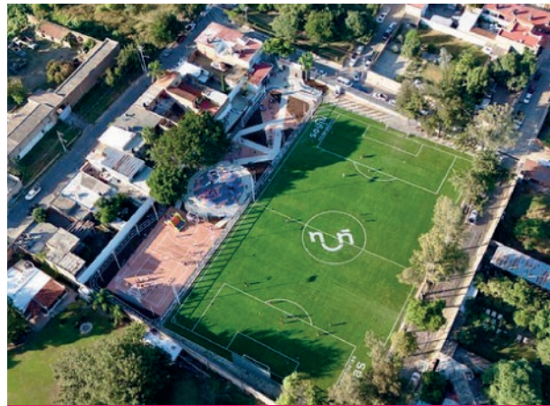
Unidad La Primavera