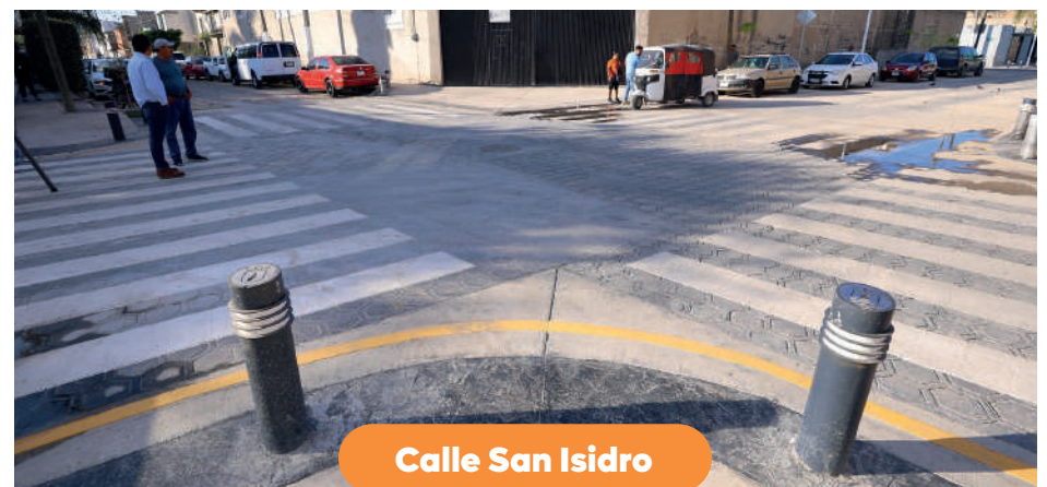
Calle San Isidro