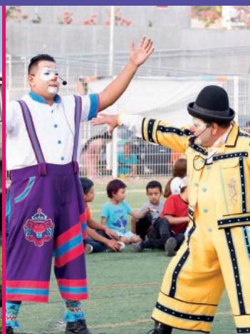
Villa de Guadalupe