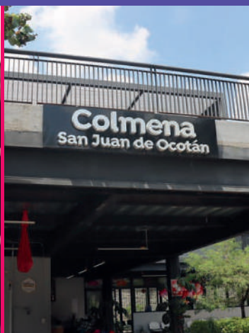
San Juan de Ocotán