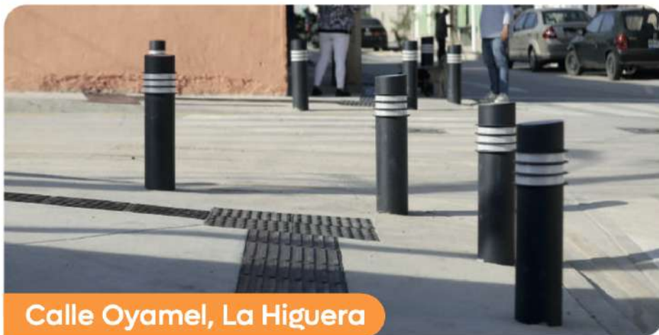
Calle Oyamel, La Higuera

A un mes del arranque de la administración, ya enchulamos las calles.