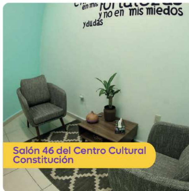
Salón 46 del Centro Cultural Constitución

Somos el primer municipio en contar con un sistema de cuidados.