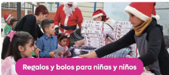
Regalos y bolos para niñas y niños

Entrega de ropa, despensas, juguetes y artículos de higiene personal en albergues.