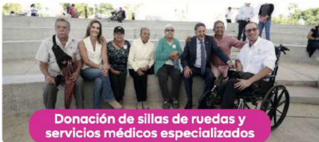
Donación de sillas de ruedas y servicios médicos especializados

El voluntariado del DIF lleva labores altruistas a las zonas más rezagadas de Zapopan