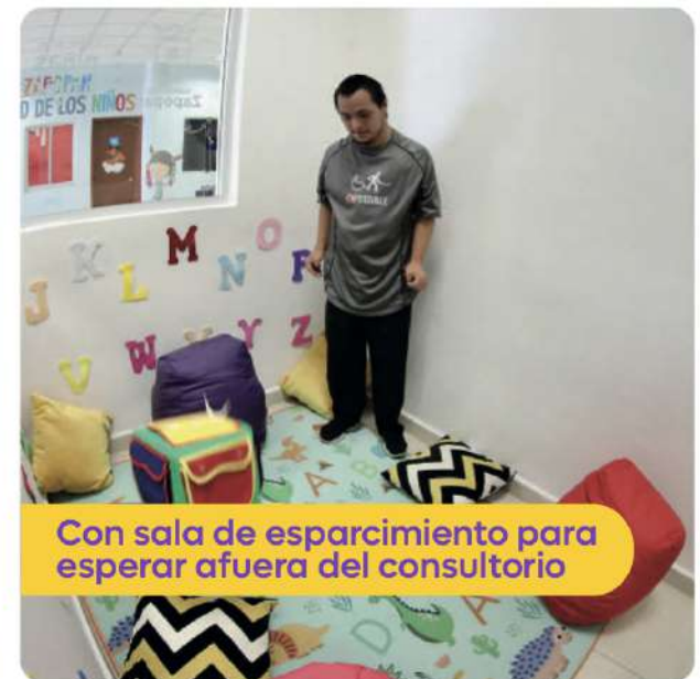
Con sala de esparcimiento para esperar afuera del consultorio