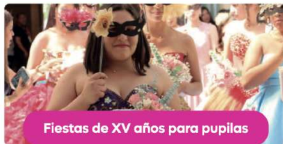
Fiestas de XV años para pupilas